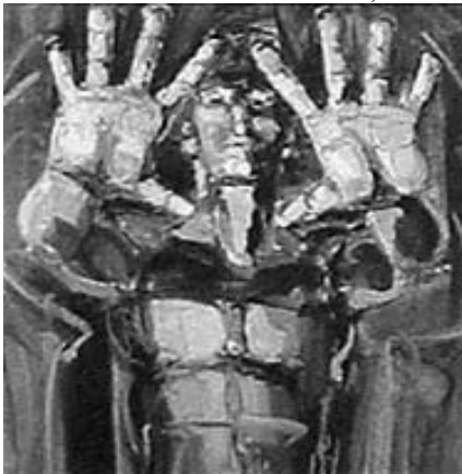
Ein Bild der Serie «Nude»

Kunst aus Belgien steht in Herford hoch in Kurs. Doch diesmal nicht in MARTA, sondern wenige hundert Meter Luftlinie entfernt, an der Walgerstraße 50, gewährt der renommierte belgische Maler Didier Maghe Einblicke in seine phantastische «Welt der Maghiere». «Sie sind meine eigenen Geschöpfe. Sie sind immer fröhlich, frei und unschuldig wie Kinder. Sie leben in einer Art Paradies, wo es